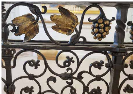
Smukke detaljer af vinklaser og blade fra gitteret omkring nadverbordet vidner om smed Hans Rasmussens kolossale kunnen indenfor sit fag.