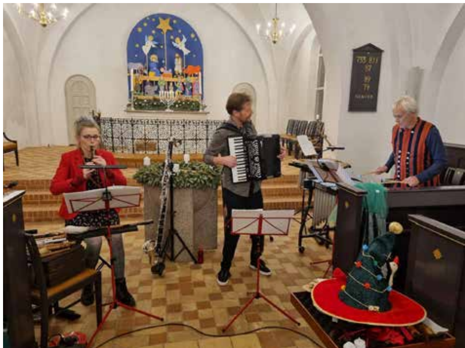
Gløgg ensemblet gav en forrygende koncert lige op til jul.