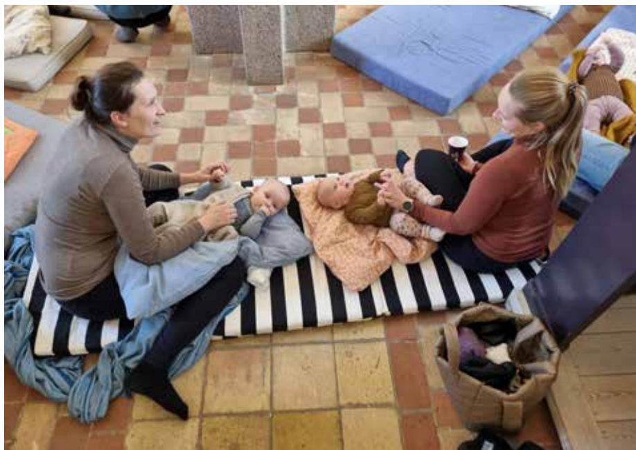
Sansemotorik for de mindste.