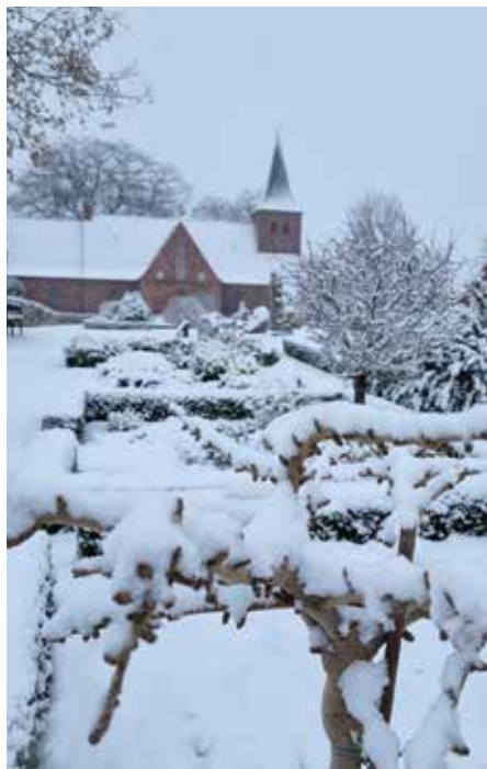
Kan I huske, da Kong Vinter herskede.