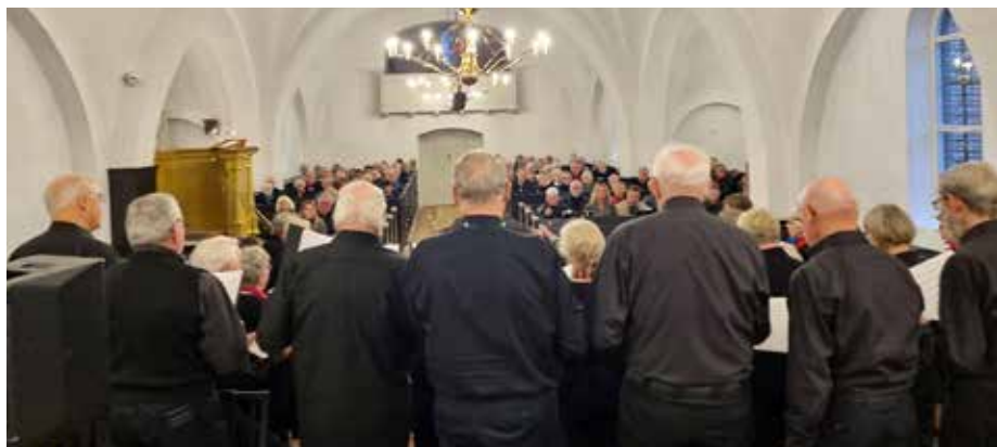
FynboKoret deltog i gudstjenesten 3. søndag i advent.

takter til dette års brugere af “Børn i den røde kirke” – og hun melder tilbage, at alt går planmæssigt. Vi glæder os temmelig meget til at se mylderet af små og store børn – i den røde kirke – den 6., 7. og 8. november!